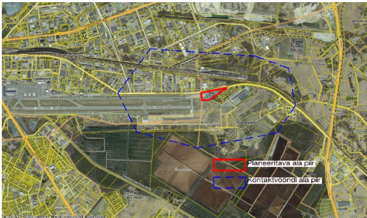
Planeeringuala (tähistatud punase piirjoonega) ja kontaktvöönd

Planeeritav ala piirneb põhjaküljel 11290 Tallinn-Lagedi tee (Suur-Sõjamäe tänav) ja selle äärse jalgratta- ja jalgteega. Tee vastasküljel asuvad olemasolevad hoonestatud tootmismaa, äri- ja tootmismaa ja jäätmeoidla maa krundid ning hoonestamata transpordi- ja ärimaa krunt, millele kavandatakse Rail Balticu veeremi hooldusdepo. Planeeritav ala piirneb läänest ja edelast Tallinna Lennujaama territooriumiga ning lõunast ja idast Ida-Tallinna tööstuspargi hetkel veel hoonestamata tootmis- ja ärimaa kruntidega.